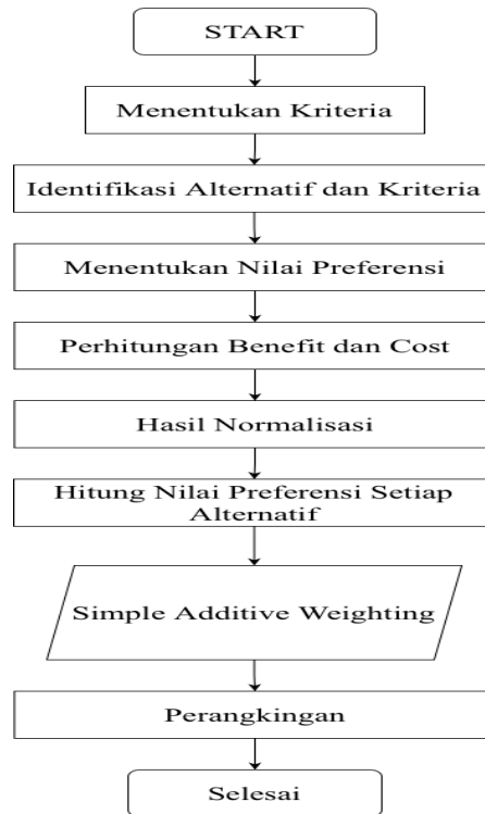
Gambar 1. Metode Simple Additive Weighting