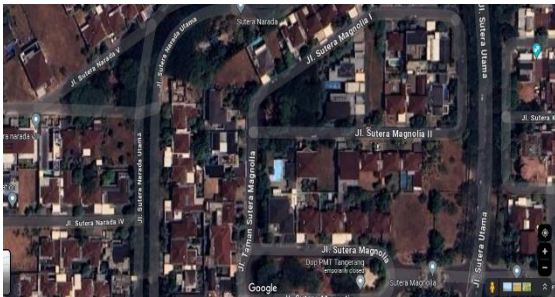
Gambar 1. Peta Lokasi

Untuk Lokasi dari pada penelitian ini berlokasi di Alam Sutera Cluster Narada